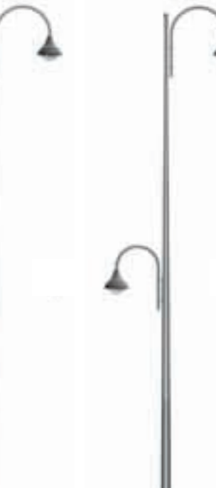
D - Kima 800