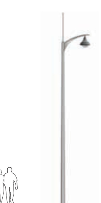
B - Taal 700