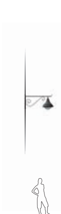
A - Murale Wall mounting