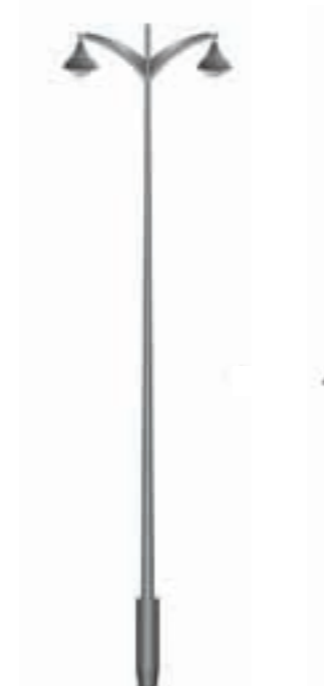
C - Jima 800