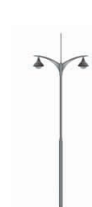
C - Kelas E 600