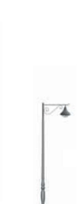
B - Ventoux 400