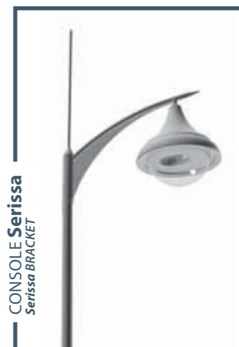
CONSOLE Serissa Serissa BRACKET