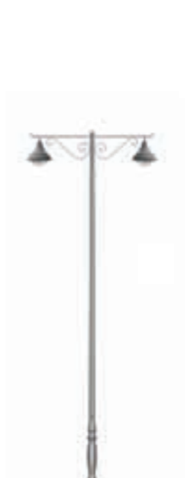
D - Ventoux 600