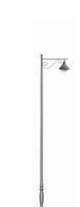
C - Ventoux 600