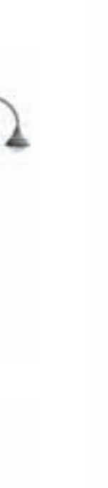
B - Jima 600