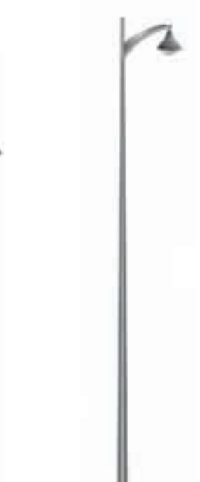
B - Jima 600