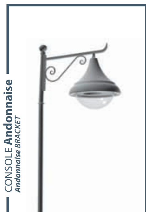
CONSOLE Andonnaise Andonnaise BRACKET