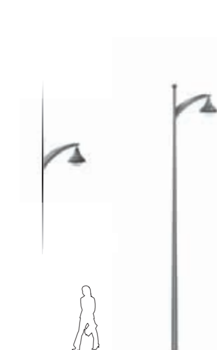
A - Murale Wall mounting