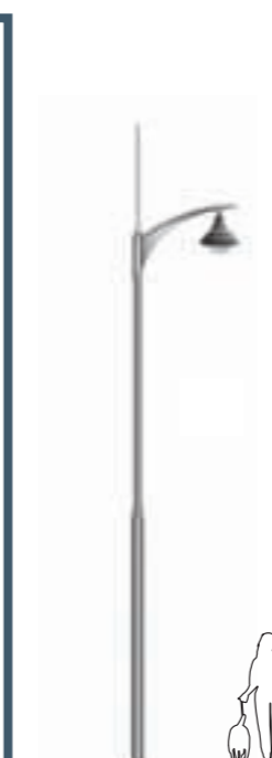
A - Kelas 600