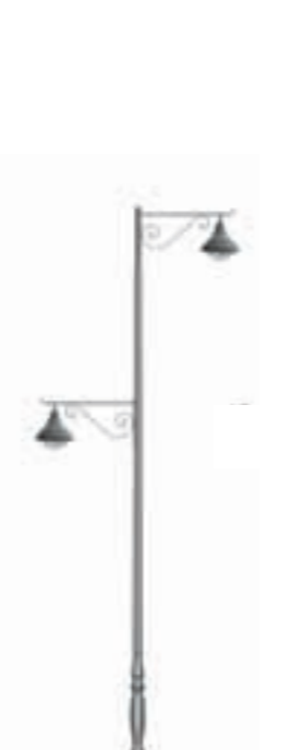
E - Ventoux 600