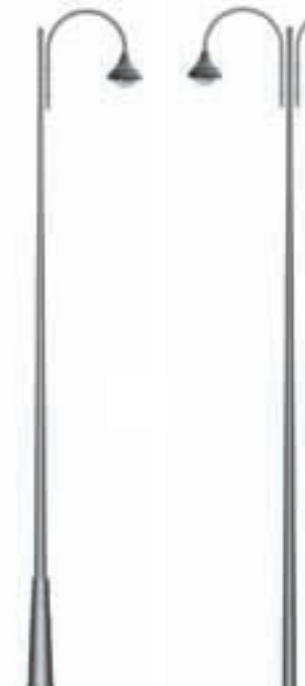
C - Kima 800 Borne Duna Duna bollard