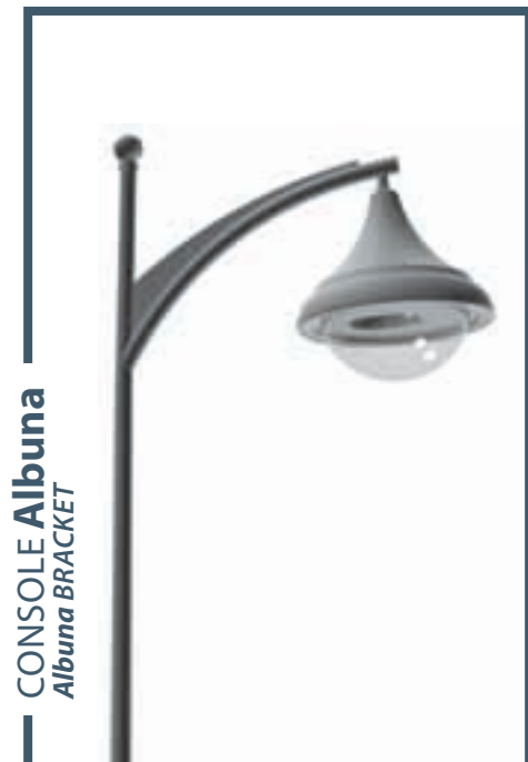
CONSOLE Albuna Albuna BRACKET