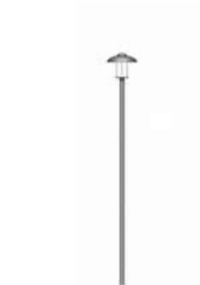
A - Pelas 350