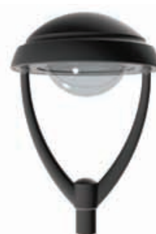
+ Version vasque ronde Round bowl version