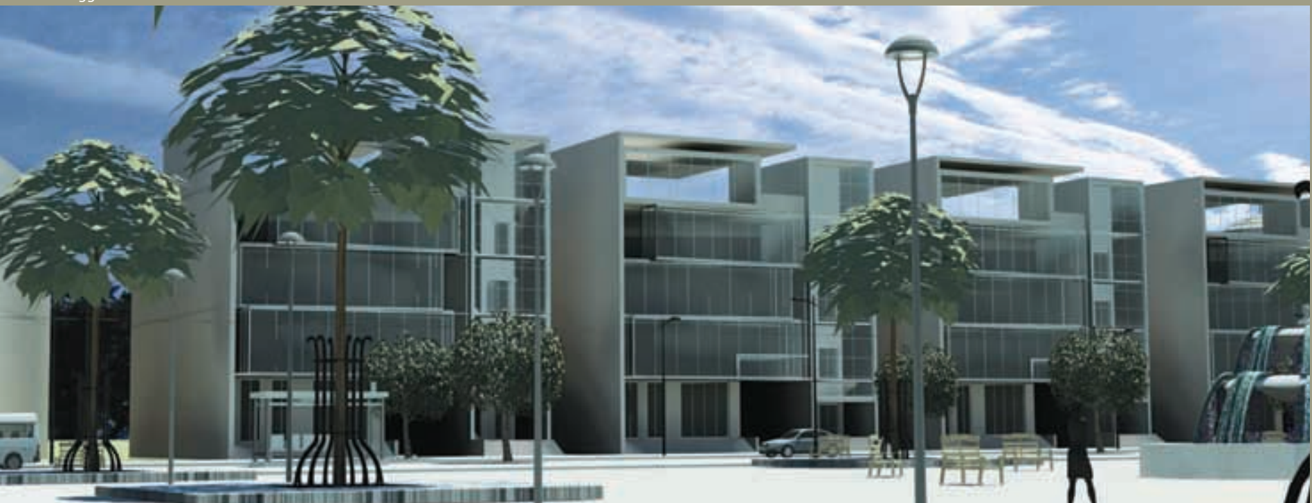
D - Jima 450