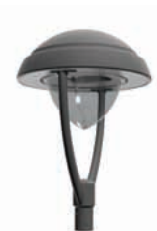
+ Version vasque ogive Ogival bowl version