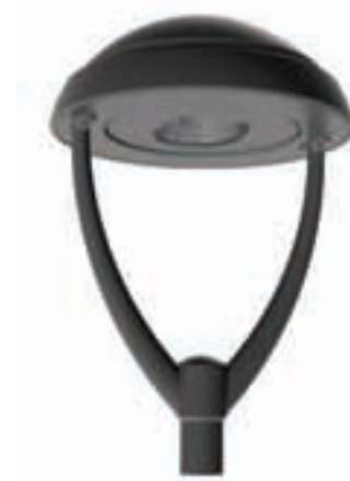
+ Version verre plat Flat glass version