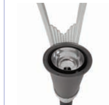
+ Accès lampe et appareillage Lamp and control gear access