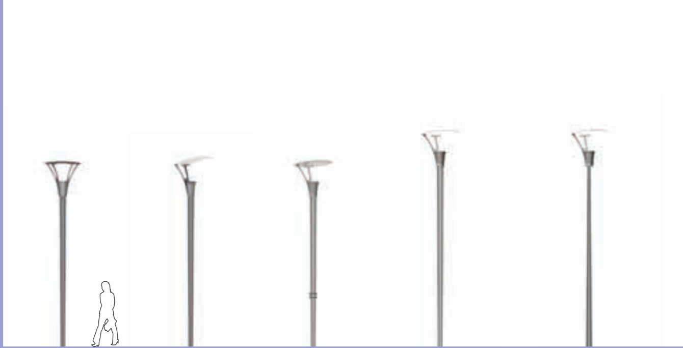
A - Dali 400 B - Dali 400 C - Dali 400 D - Dali 500 E - Jima 500

Linéa Propositions d'ensembles Suggestions for ensembles