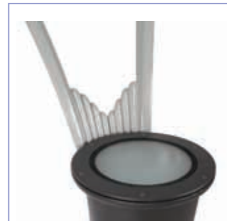
+ Verre trempé sablé Sand tempered glass

Dark black RAL 9005, Textured grey 2900 Textured grey 2150, Textured grey 2900 + Textured grey 2150