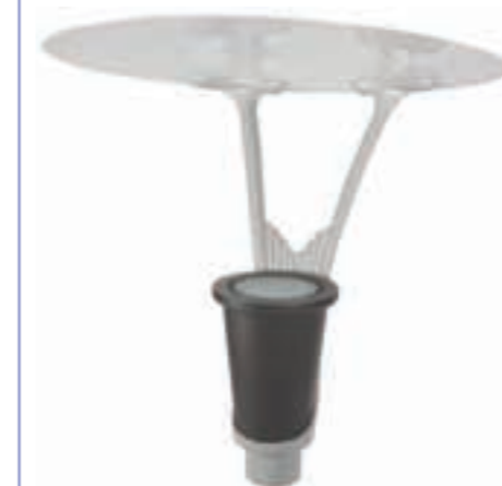
+ Dôme en matériau composite blanc Dome in white composite material