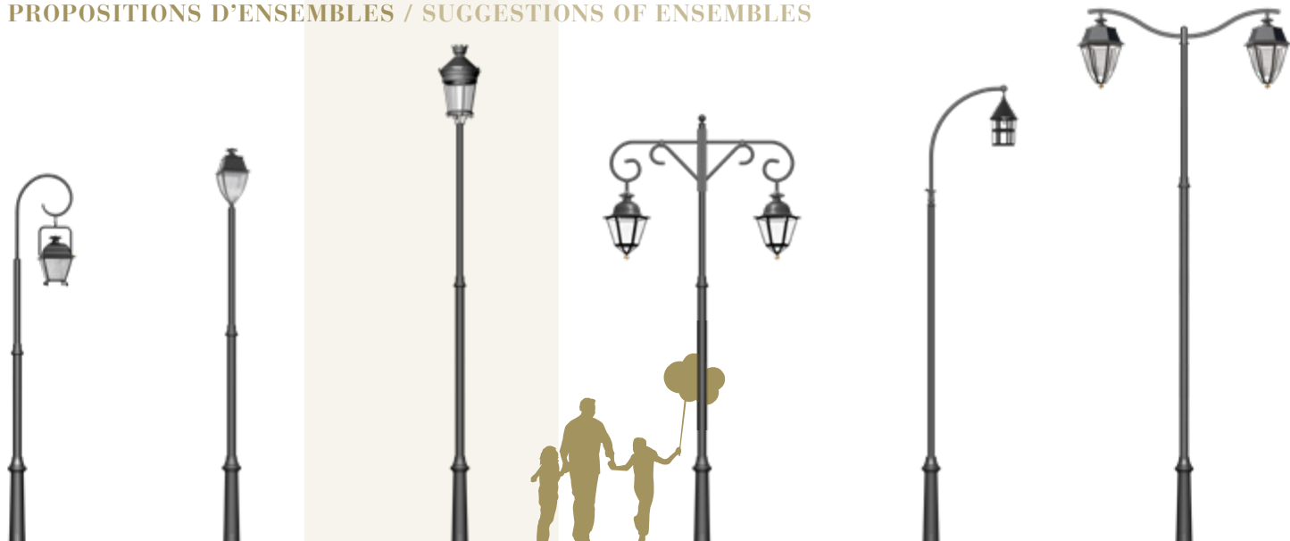
ILION 350 OLYMPIA 48 MANDELIEU 640