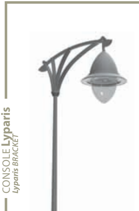
CONSOLE Lyparis Lyparis BRACKET