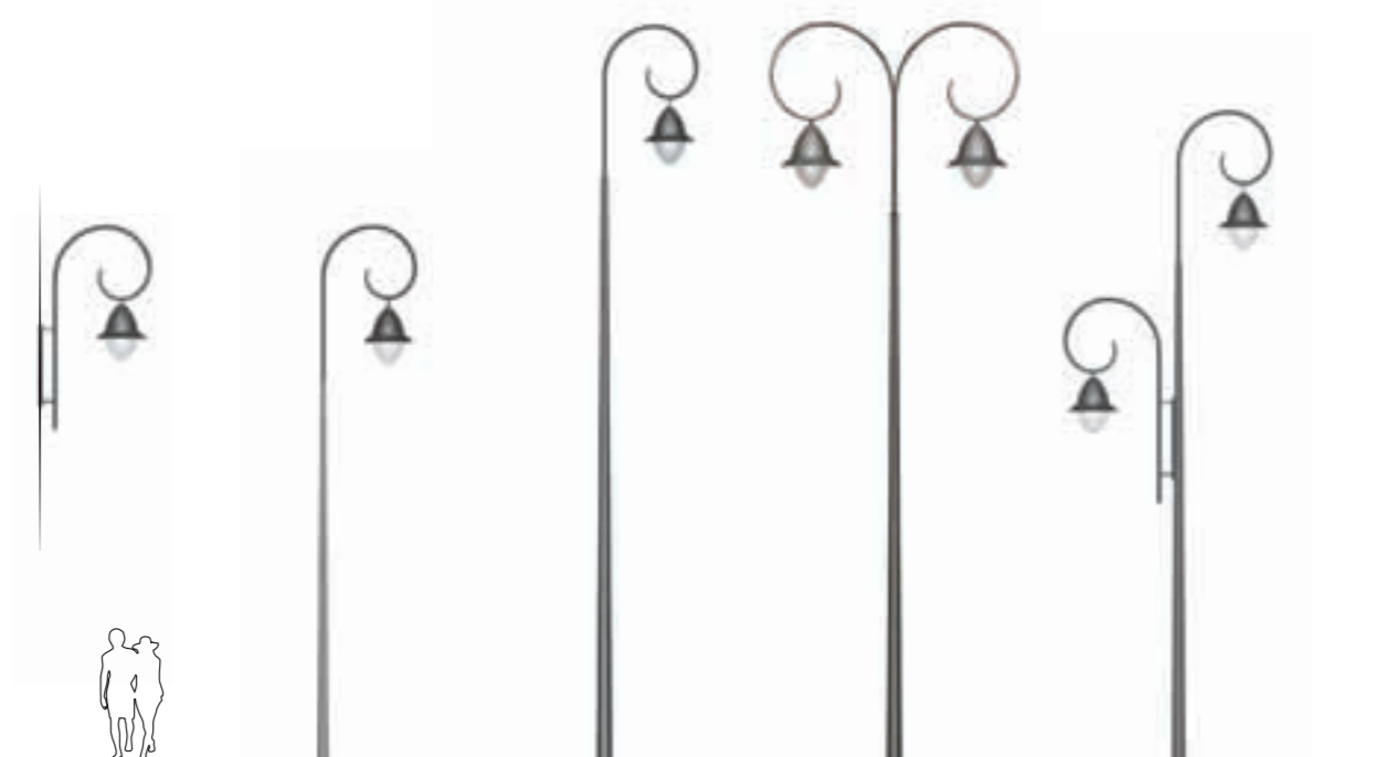
A - Murale Wall mounting B - Kea 600 C - Kima 800 D - Kima 800 E - Kima 700

Gardénia Propositions d'ensembles Suggestions for ensembles