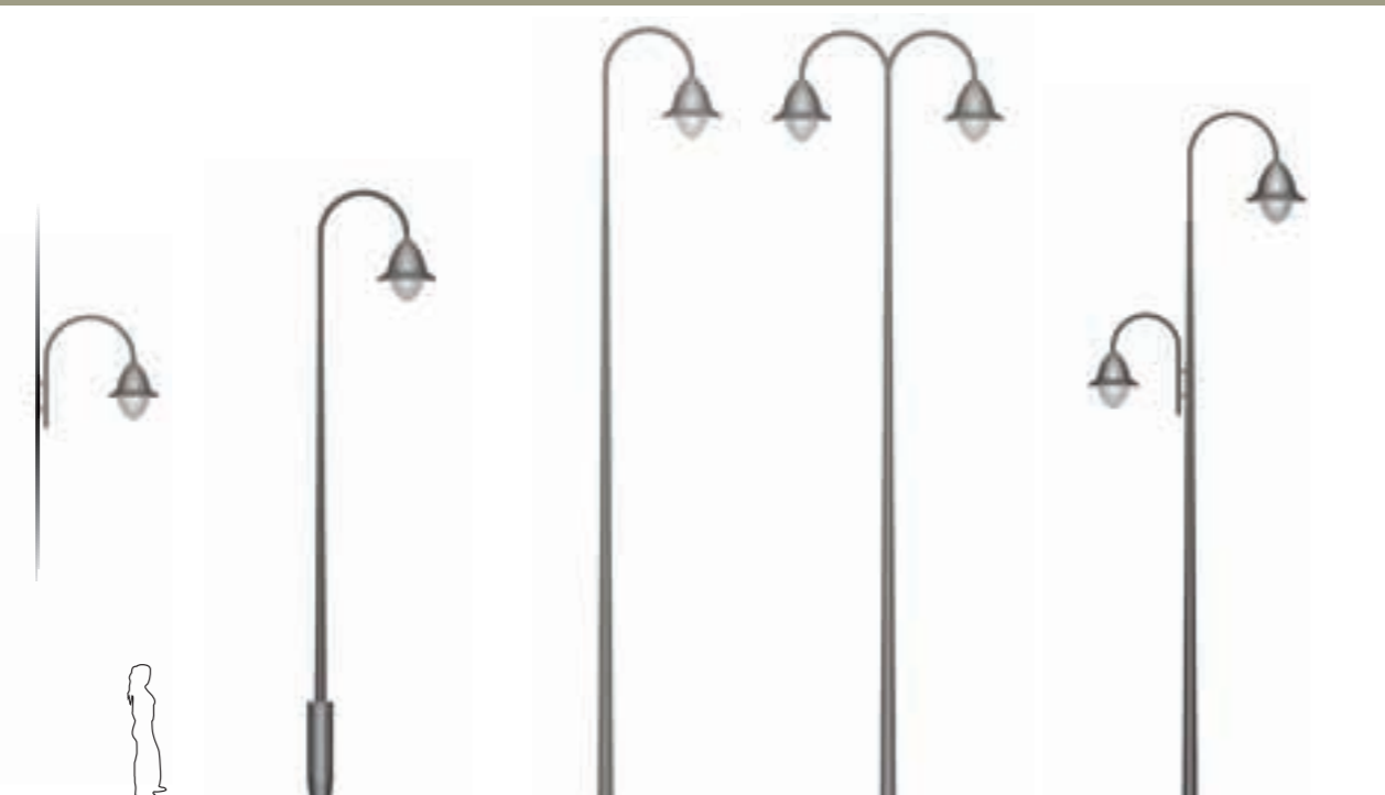
A - Murale Wall mounting B- Jima 600 borne Camelia Camelia bollard C - Jima 800 D - Kima 800 E - Kima 700