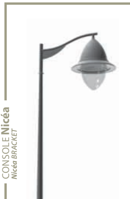
CONSOLE Nicéa Nicéa BRACKET