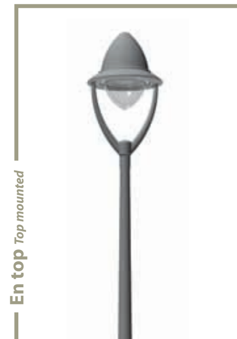
En top Top mounted