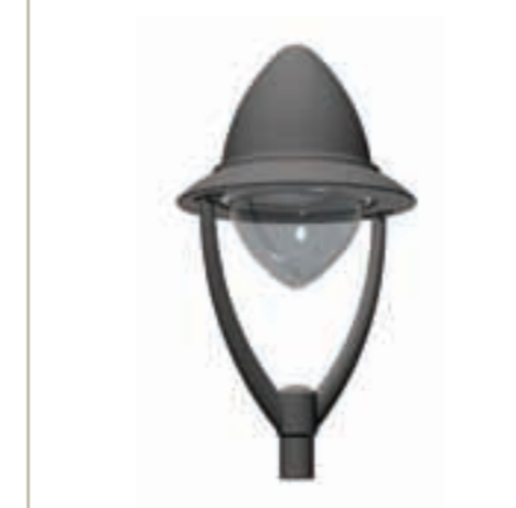
+ Lyre dédiée en fonderie d'aluminium Dedicated cast aluminium yoke