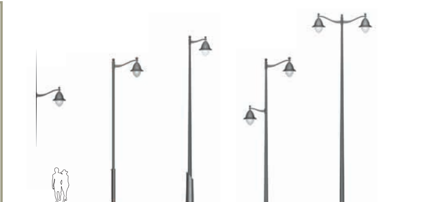
Gardénia Propositions d'ensembles Suggestions for ensembles