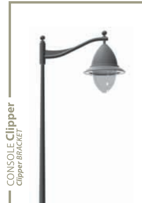
CONSOLE Clipper Clipper BRACKET