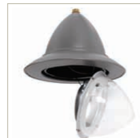
+ Accès lampe et appareillage Lamp and controlgear access