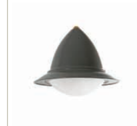
+ Version vasque demi-ronde Semi-rounded bowl version