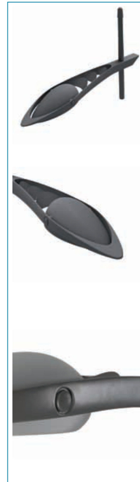
+ 3 ailettes décoratives 3 decorative louvers

Top mounted: Ø76 Depth of insertion: 500mm Color Standard Various colors available