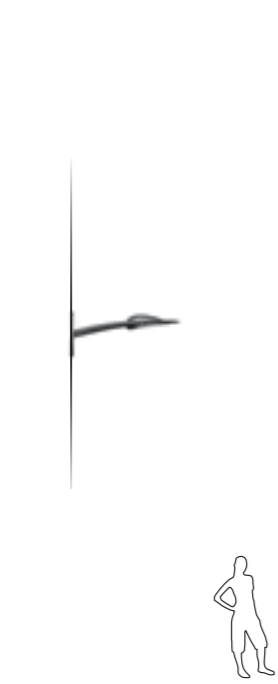
A - Murale Wall mounting