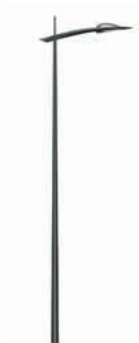
C - Java 800