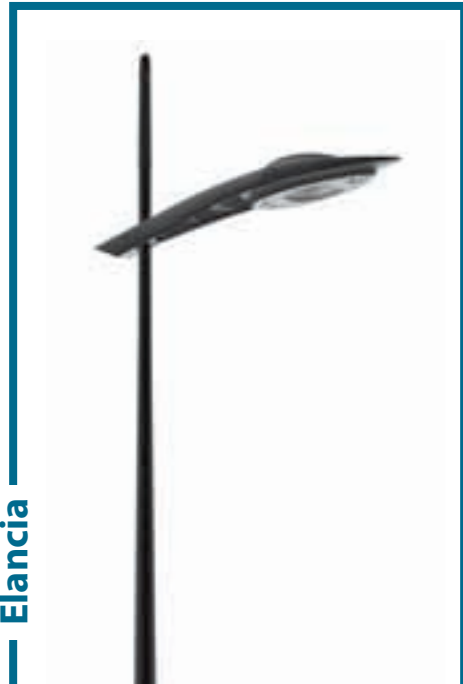
Propositions d'ensembles Suggestions for ensembles