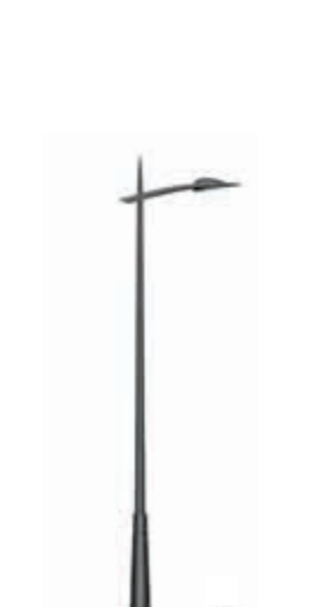
D - Java 600 borne Duna Duna bollard