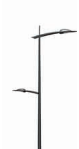
G - Java 600