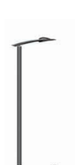
B - Eliptika 700