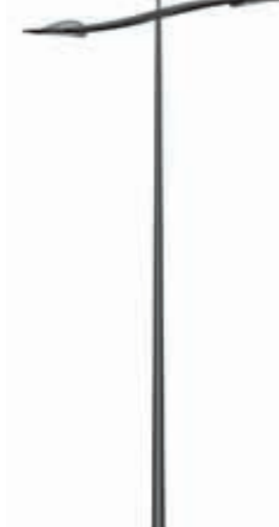
F - Java 800